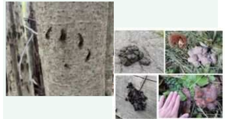
食べたもの：「上段左から」葉っぱ、クマ （下段左から）サクラの実、カキ